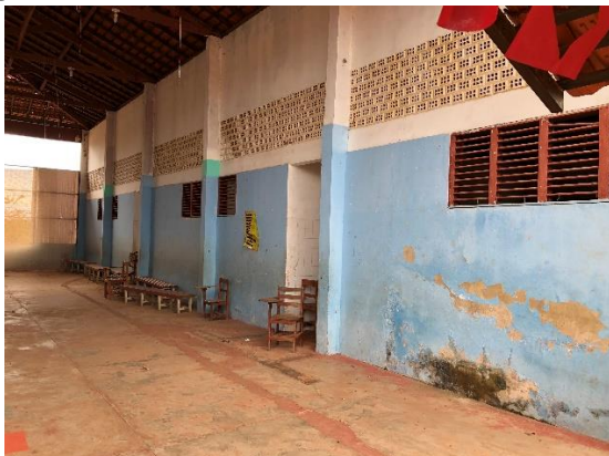
Figura 05 – Problemas no reboco