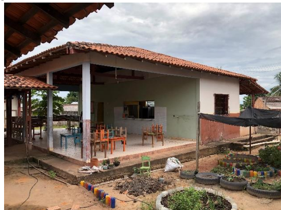
Figura 06 – Bloco de Refeitório e Cozinha