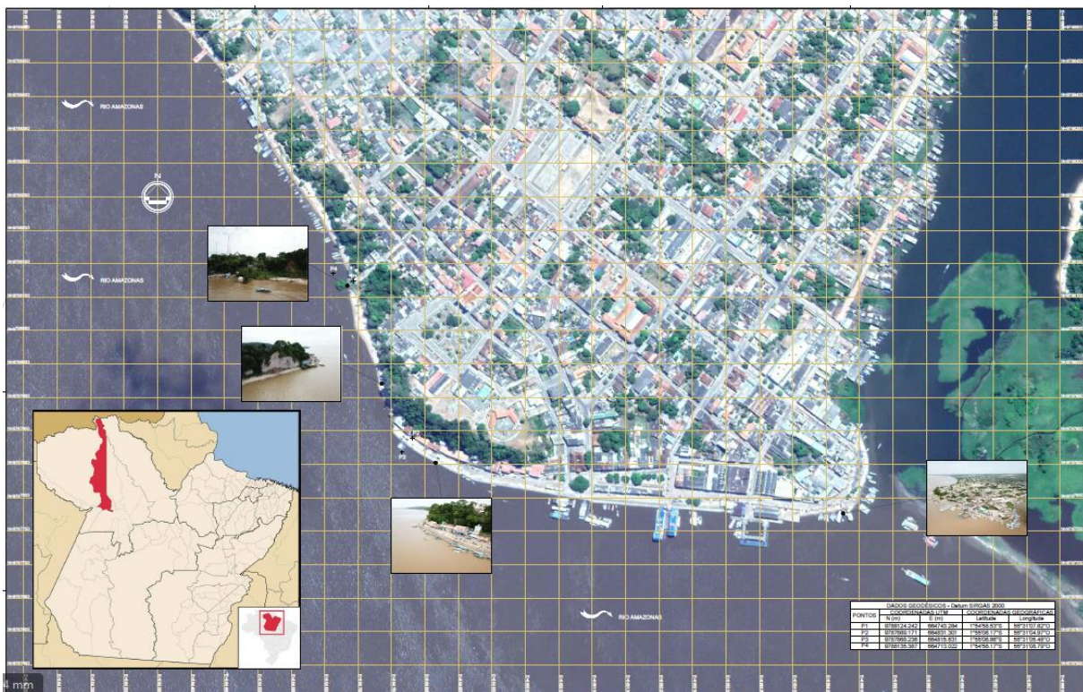
Fig. 1 – Planta de Localização – Município de Óbidos

O município de Óbidos é ligado pelas rodovias BR-163, que se estende até a cidade de Curuá e a rodovia estadual PA-254, com quem a BR-163 faz entroncamento para ligar a cidade de Óbidos à cidade de Oriximiná. A cidade possui também o Aeroporto de Óbidos (SNTI) localizado ao norte do município cerca de 5km do centro da cidade.