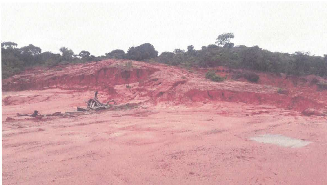
Figura 1 – Área a ser Explorada