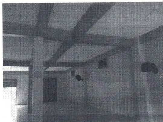
Foto 03 – Vista do piso cerâmico e dos pilares em concreto armado. Foto 04 – Vista dos vigas e lajes em concreto armado.