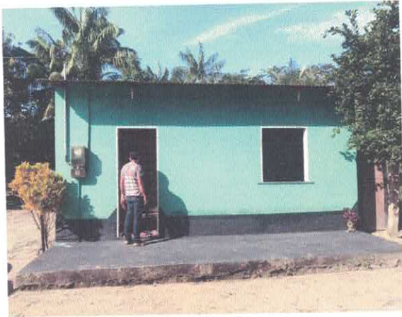
Foto 01 - Fachada Principal