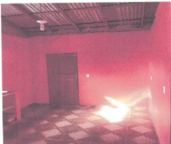
Foto 05 - Cozinha