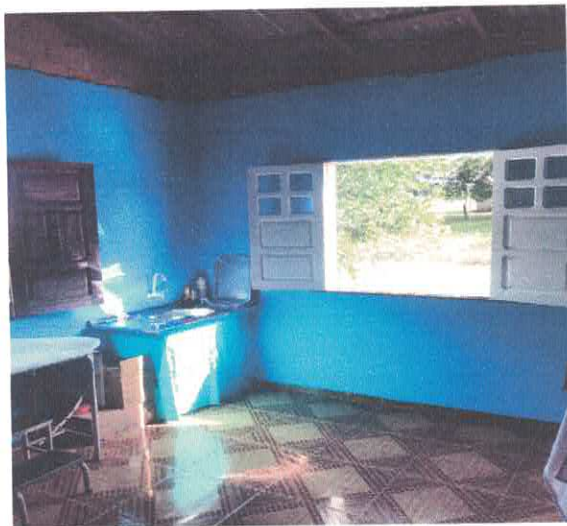
Foto 03 - Foto Cômodo 01