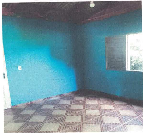
Foto 04 Foto Cômodo 02