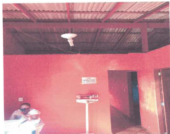
Foto 06 - Sala