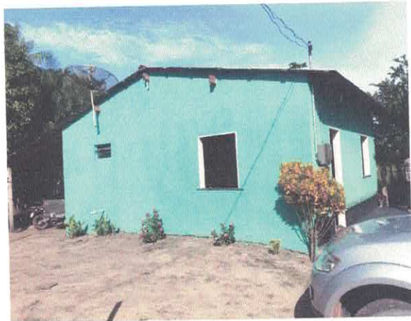
Foto 02 - Fachada Esquerda