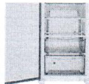
Freezer Brastemp BVR28H Vertical Branco 228L